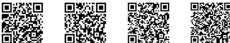
Obr. 2. QR kódy adresy http://frcatel.fri.uniza.sk/~beerb s rôznymi úrovňami schopnosti opravy chýb (úrovne L, M, Q, H zľava doprava) vygenerované pomocou generátora Morovia – Free online QR Code Maker

Existuje samozrejme oveľa viac generátorov QR kódov. Nie je problém po niekoľkých sekundách strávených na internete nájsť ďalšie vyhovujúce online generátory. Druhou možnosťou ako generovať QR kódy je investovať trochu času do vzdelania a vytvoriť ich pomocou \text{\LaTeX} -u.