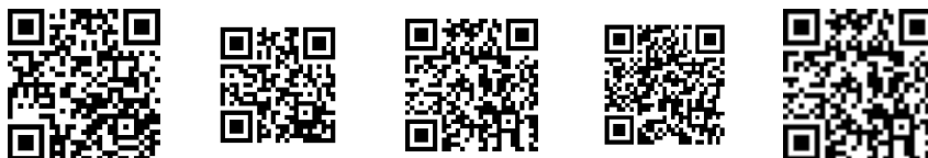
Obr. 1. QR kódy adresy http://frcatel.fri.uniza.sk/~beerb vygenerované pomocou uvedených online generátorov (po rade zľava doprava)

množstvo textu, výsledný obrázok je možné stiahnuť vo formátoch .svg , .eps , .jpg a .pdf , ale je potrebná free registrácia (e-mail a heslo). V menu sú voľby pre generovanie QR kódu pre webovú adresu, text, Vcard, SMS.