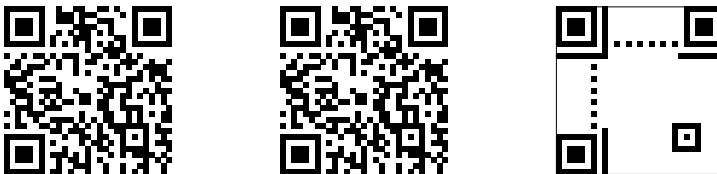
Obr. 6. QR kódy adresy http://frcatel.fri.uniza.sk/~beerb vygenerované pomocou balíčka qrcode bez parametrov (vľavo), s parametrom nolink (v strede) a s parametrom draft (vpravo)

Najpoužívanejšie hodnoty nepovinného parametra voľby príkazu \qrcode sú: