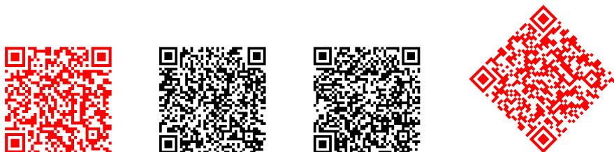
Obr. 5. QR kódy adresy http://frcatel.fri.uniza.sk/~beerb vygenerované pomocou balíčka pst-barcode s rôznymi parametrami

Pri sádzaní QR kódu môžeme medzi PS voľby pridať nastavenia pre korekciu chýb eclevel=L (ďalšie možnosti sú M , Q , resp. H ), pre formát symbolov format=micro alebo format=full . Ďalej je možné nastaviť verziu version=1 až version=40 pre formát full (korekcia chýb je implicitne nastavená na M ), resp. version=M1 až version=M4 pre formát micro (korekcia chýb je implicitne nastavená na L ). Ešte môžeme nastaviť typ znakov napr. encoding=alphanumeric , encoding=numeric , encoding=byte , encoding=kanji .